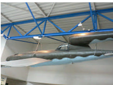
A gauche, un V1.