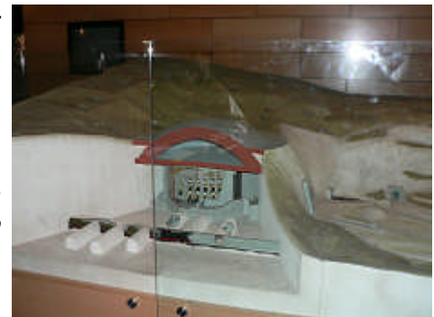
A droite, une partie de la maquette montrant le fonctionnement de la base.