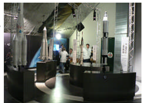
A droite, des maquettes de « l'espace fusées ».