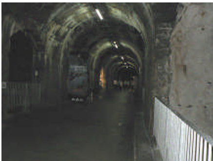
A gauche, un des tunnels creusés par les détenus.